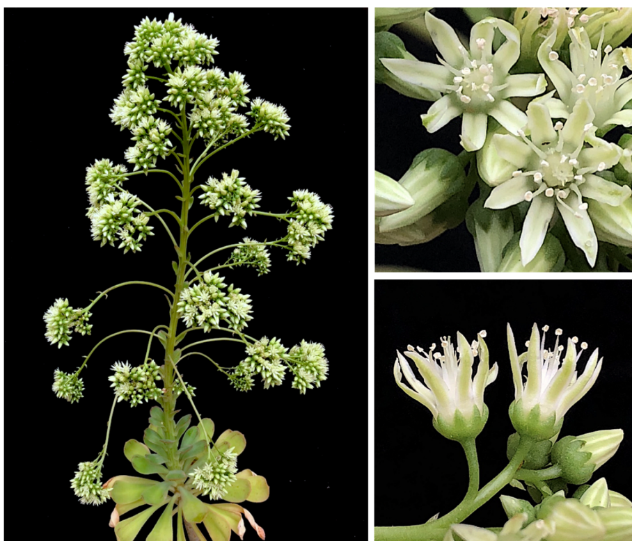
Figura 2. Inflorescencia y detalle de las flores de Aeonium liui Arango sp. nov.

Primordios florales cónico-ovoideos, con los pétalos en disposición sinistrorsum. Flores con la corola radial simétrica y forma acampanada, de 10-12 mm de diámetro y 8 (7-9) partes. Pétalos ensiforme-lanceolados, glabros, con el ápice agudo, apiculado y suavemente serrulado, de color blanco amarillento con matices verdosos por la cara abaxial, de 9-10 mm de largo por 2,0-2,2 mm de ancho. Estambres verticilados, con filamentos blancos, glabrescentes, los antepétalos de 7,0 mm y los interpétalos de 9,0 mm de longitud. Anteras ovoideas, de color amarillo pálido, basifijas y con dehiscencia longitudinal; las anteras de los interpétalos maduran antes que las de los antepétalos. Carpelos blancos, glabros, con ovarios de 3,0 mm y estilos de 5,0 mm de longitud no divergentes. Nectarios de forma cuadrangular con el borde superior emarginado y la base ligeramente atenuada, de 0,5 x 0,6 mm. Semillas de 0,8 mm de largo por 0,2 mm de ancho, con surcos longitudinales más oscuros. Fenología : florece de junio a julio. (Figuras 2 y 3) (Tabla I).