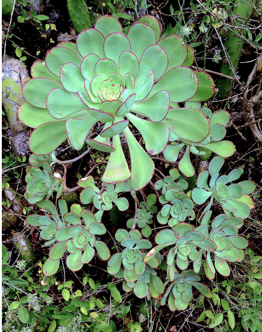
Figura 5. Aeonium liui Arango sp. nov. en su hábitat, Tenerife, península de Anaga.

en algunos sitios llega hasta las zonas áridas cercanas a la costa. En términos bioclimáticos su hábitat corresponde al de un clima infra y termomediterráneo, cuyas principales características son las de un territorio seco, soleado, con una temperatura media de 19-21 °C, una pluviometría anual < 300 mm, y frecuentemente sometido a un régimen de vientos de componente norte por alisios (SANTANA, 2014). En los múltiples trabajos de campo que hemos realizado por toda la isla de Tenerife, no hemos encontrado A. liui en ninguna otra localización, por lo que consideramos que se trata de un endemismo exclusivo del extremo este de la península de Anaga (Figura 4 y 5).