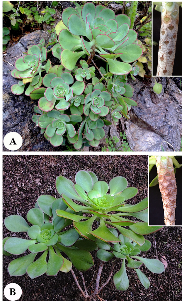
Figura 6. Foto de las plantas y detalle del tallo, en las que se aprecia la diferencia entre ambas especies. A) Aeonium liui sp. nov.; B) Aeonium ciliatum .

finales de febrero en algunas zonas cercanas a la costa NO, hasta finales de julio en la vertiente SE de la isla.