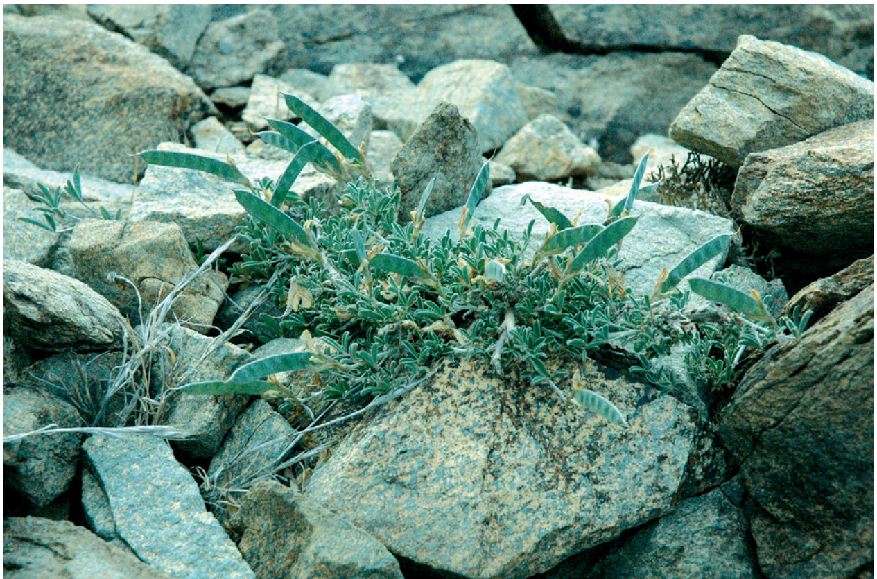
Fig. 3. Argyrobium armindae Marrero Rodr., en su localidad clásica de la montaña de Amagro: arriba, planta en plena floración; abajo, planta en fructificación.