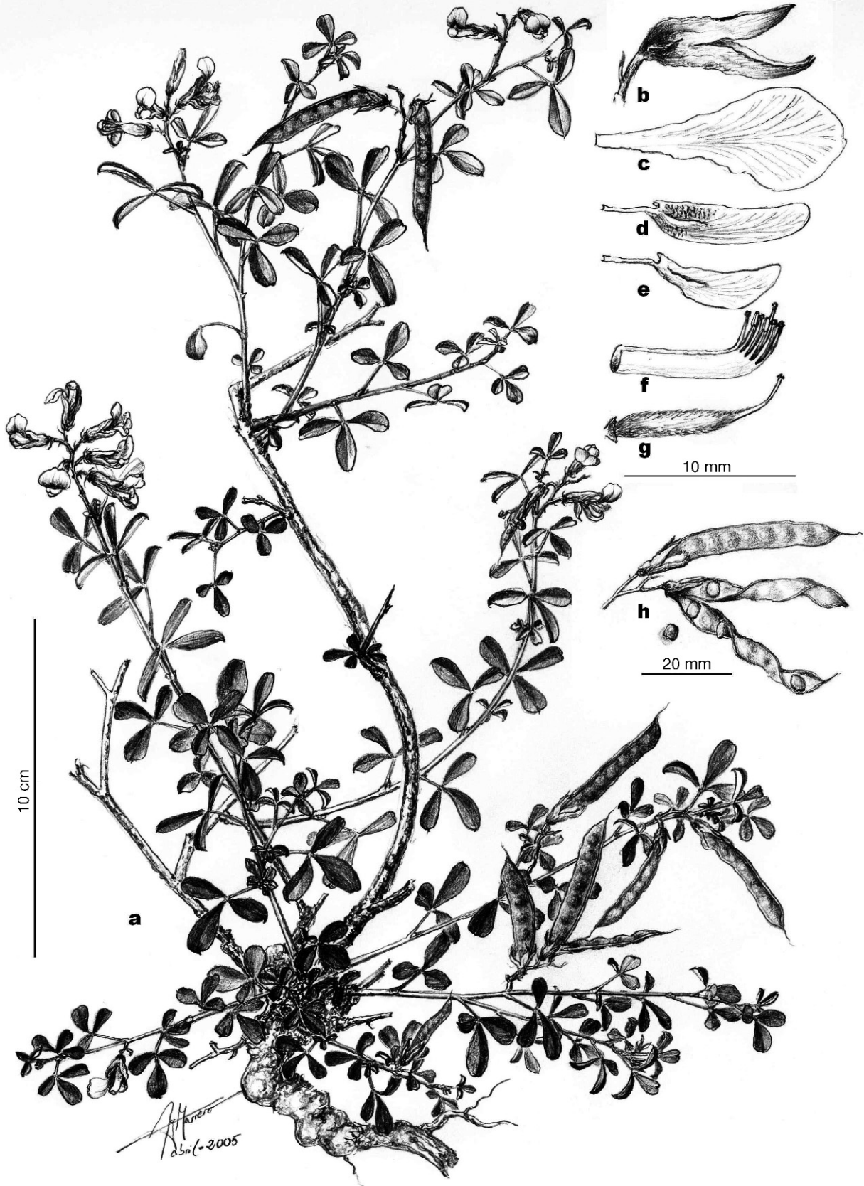
Fig. 2. Argyrolobium armindae : a , hábito; b , cáliz; c , estandarte; d , alas; e , quilla; f , androceo; g , gineceo; h , frutos y semillas; a-g, composición de diferentes apuntes sobre el material tipo (LPA 22522, holótipo e isótipos); h, apuntes sobre material recogido el 11-V-2005 (LPA 22532, parátipos).