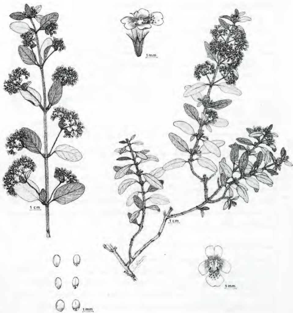
Bystropogon wildpretii I. La-Serna, sp. nov.