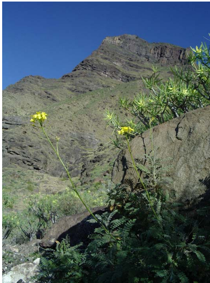
Figura 3.- Habitat de Descurainia artemisioides Svent