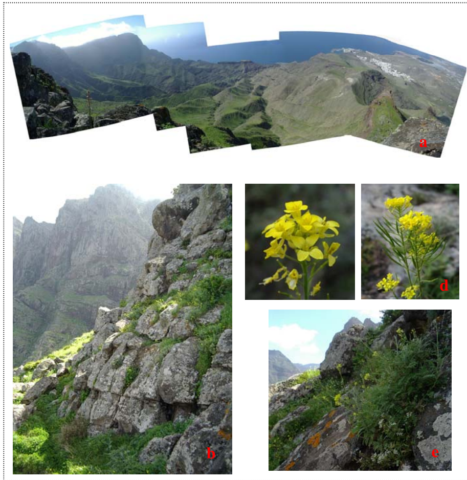
Figura 1. Descurainia artemisioides . a: Panorámica que abarca varias localidades como Roque Bermejo, Roque de la Sombra, Morro Abejero, Pico Gavilán y Los Ancones (Tamadaba). b: población de las Goteras. c y d: Detalle de una inflorescencia en flor y con frutos. e: Porte de la planta.

individuos, barranco del Palo Blanco 50 efectivos y por último para Güigüí 595 individuos (en las tres últimas poblaciones en 2 cuadrículas UTM de 1x1Km).