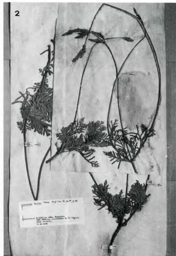
Fig.1-2: Material original perteneciente a Lavandula buchii Webb; 1: TYPUS (FI!!:lecto); 2: material con la numeración arbitra ria aludida y carente de etiqueta -ver comentario tipificación-.