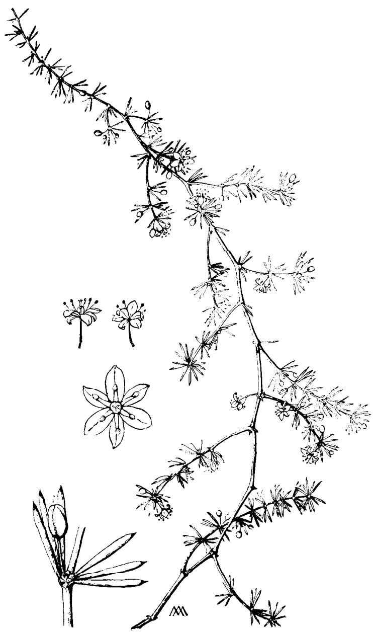
Asparagus nesiotes , rama florífera = 1/2, dos flores = 1, flor diamétrica y detalle de filocladios = 2,5 — Dibujo por Mary Anne Kunkel.