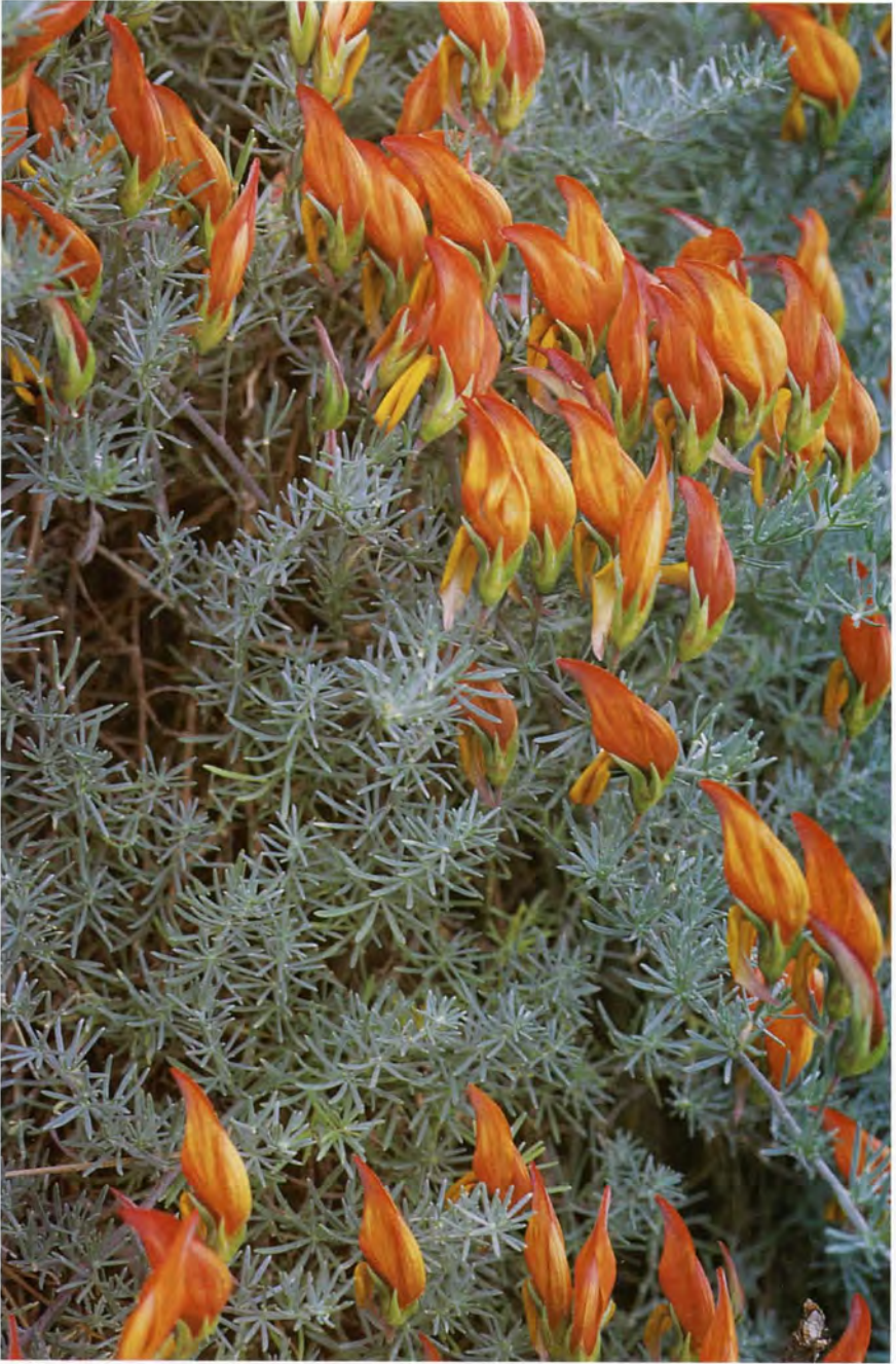
Fig. 2.- Lotus pyranthus sp. nov.