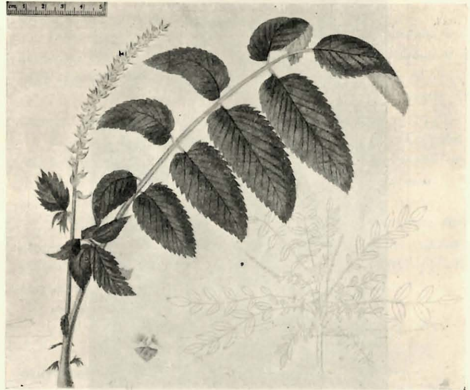
Poterium caudatum Ait. Reproducción fotográfica de la lámina núm. 2.341, en Curtis Botanical Magazine .

cando, entre las islas Canarias, las de Tenerife, Palma, Gran Canaria y Hierro. No poseemos ninguna referencia de que exista en la isla de Gomera y tampoco la hemos encontrado por allí, aunque puede admitirse como muy probable.