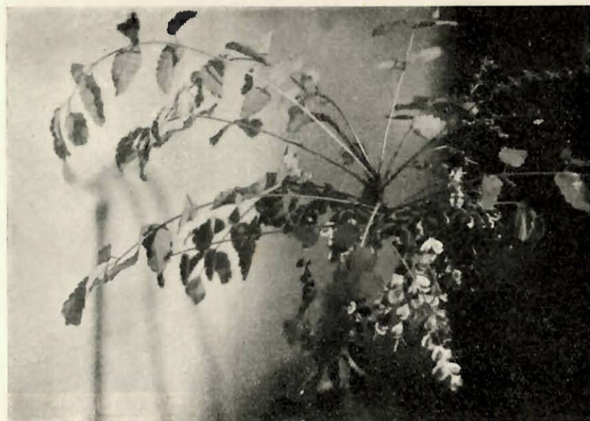
Marcella Moquiniana (W. et B.) Svent. Planta femenina.

Descripción suplementaria nuestra. — Planta femenina: Inflorescencias numerosas, aglomeradas en la parte superior del tallo. Racimo