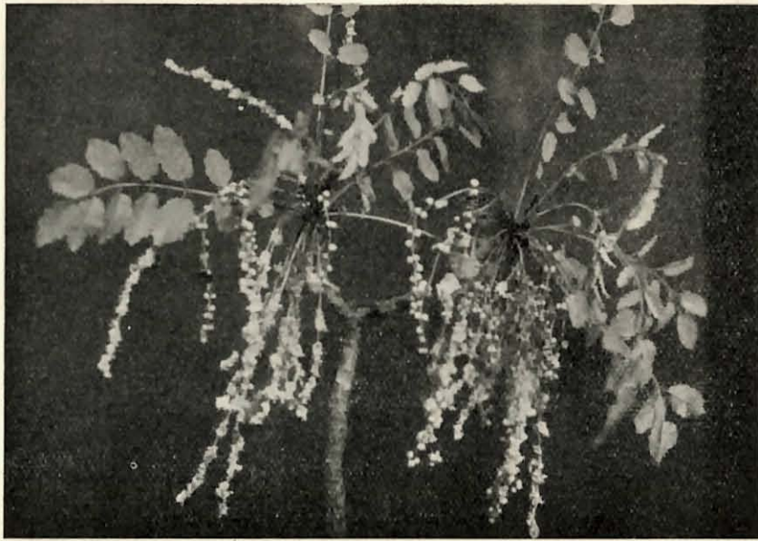
Marcetella Moquiniana (W. et B.) Svent. Planta masculina.

queña glándula albo-pilífera en el ápice, deflexos y persistentes hasta media madurez del fruto; estilos, generalmente 2 (alguna vez 3, especialmente en la espiga final), purpúreos; estigma en forma de pincel, compuesto por 30-40 lacinias.