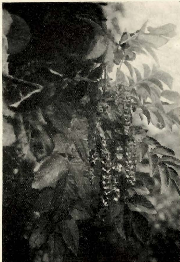
Bencomia caudata Ait. W. et B. Planta femenina.

B. caudata , aunque la más extendida entre todas, es la más expuesta a una disminución, por irse cambiando en su disfavor el am-