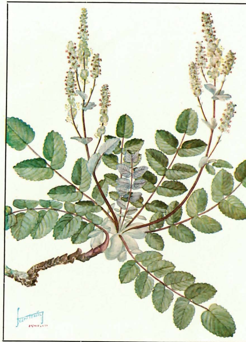
Dendriopoterium Menendezii Svent.

Inflorescencia más larga que las hojas, erecto-patente, formando panícula sencilla o compuesta; pedúnculo glabro, atrovioletado y glauco-farinoso; bractéola tan amplia como larga, aovado-romboidea, entera o trilobada, profundamente crenulada, submembranácea, glabra y glauco-pruinosa, las inferiores a menudo sustituidas por un folíolo peciolulado y estipulado; espigas erectas — tanto antes como después de la antesis —, alargadas, pedunculadas, con flores masculinas infe-