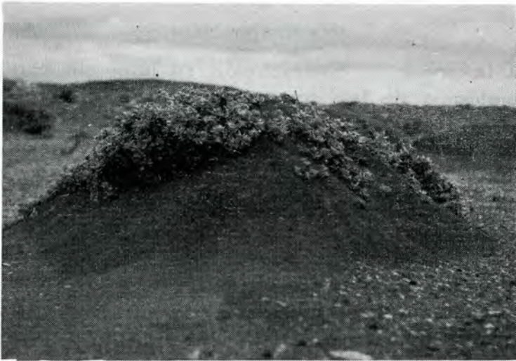
Polycarpea nivea Ait.