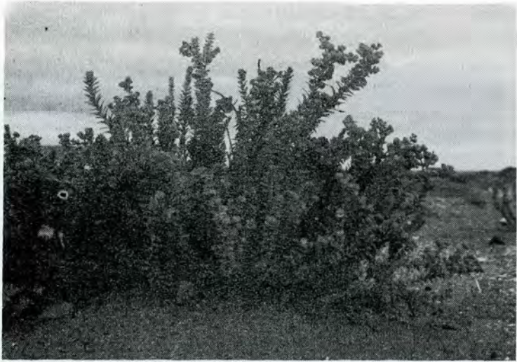
Euphorbia paralias L.