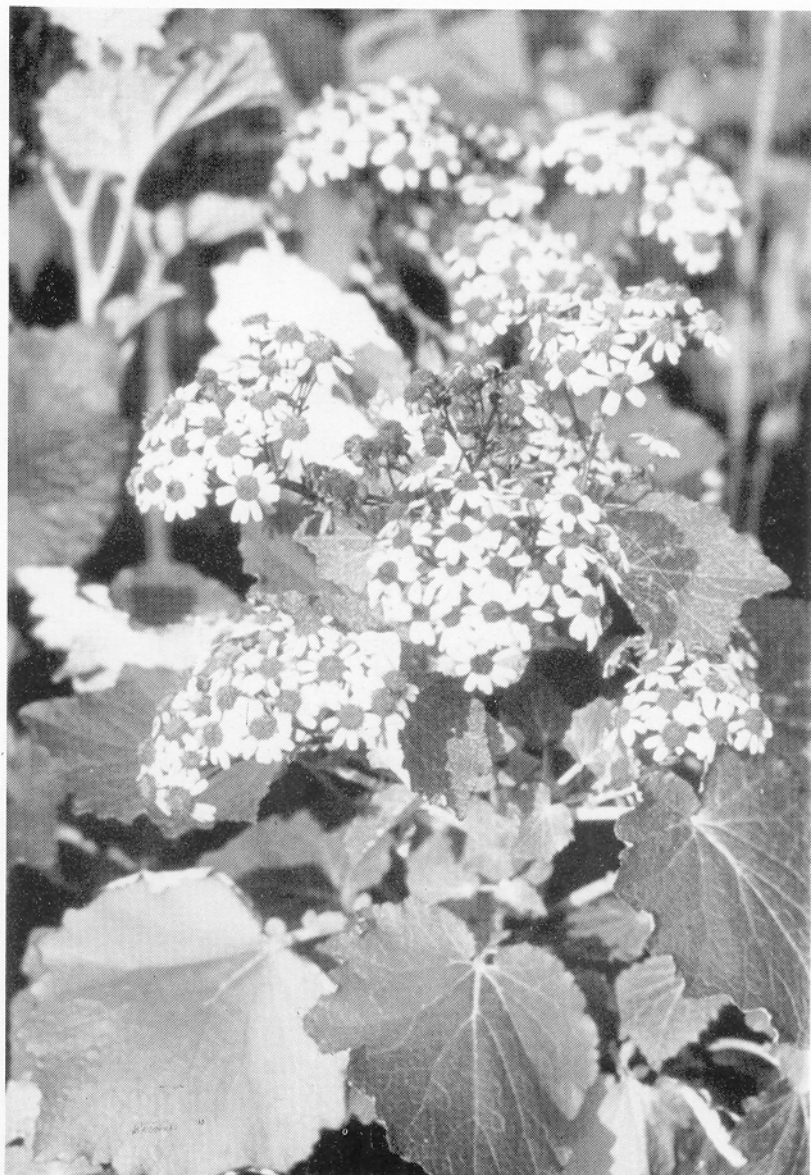
Lámina 2. Ejemplares de Senecio appendiculatus (L.fil) var. preauxiana Sch.Bip., cultivadas en el Jardín Botánico "Viera y Clavijo", procedentes del Barranco de Aison (Guía, Gran Canaria).